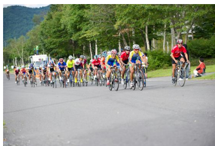
第2ステージ（クリテリウム）