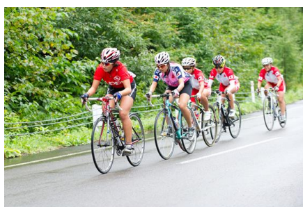
第4ステージ (ロードレース)