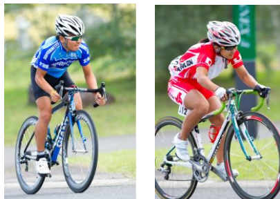
第1ステージ（タイムトライアル）