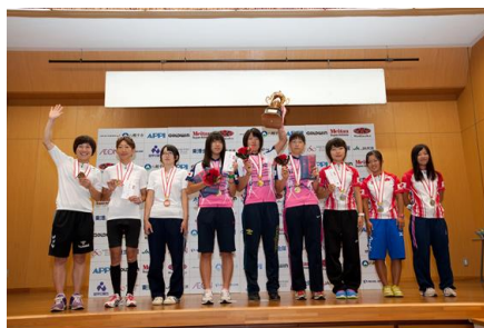
女子の部 (個人総合、団体総合表彰式)