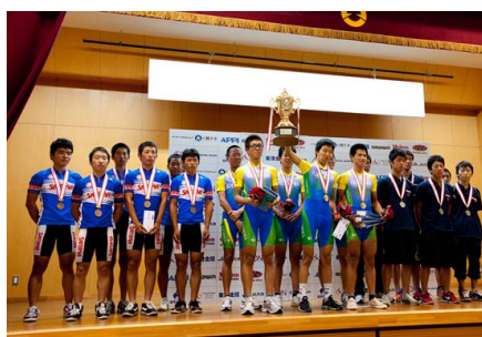
男子の部 (個人総合、団体総合表彰式)