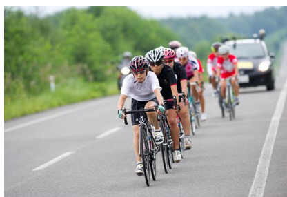
第3ステージ (ロードレース)